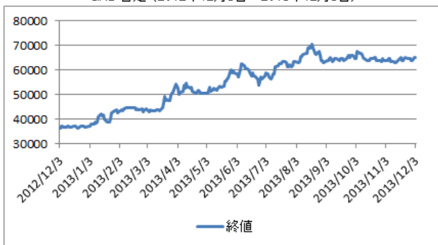
GAS 日足 (2012年12月3日~2013年12月3日)

(データはブルームバーグ、ホーチミン証券取引所) (単位:時価総額は10億ドン、ROEは直近12ヶ月)