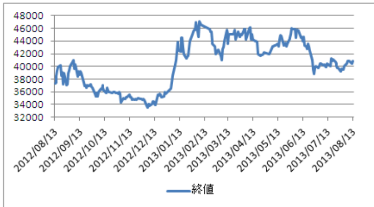
DPM 日足 (2012年8月13日~2013年8月13日)

輸入が減少してします。国内製品と競合しているのは、中国からの安価な輸入品ですが、DPM の高品質の製品は、フーミー・ブランドとして、顧客に広く浸透してうえに、国内に強力な販売ネットワークを持っていることが強い競争力となっています。